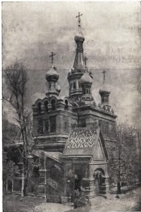
Внешний вид Свято-Николаевского собора